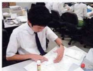
企業就労（事務系業務）

日々の学校生活や現場実習などを通して、自分のやりたいこと、できることを考え、働く意欲や挑戦する気持ちを大切に育みます。進路面談を実施し、主体的に進路選択・決定できるように指導しています。