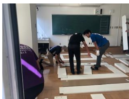
書棚の組み立て等