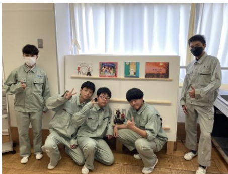
オーダーメイドの書棚の作成