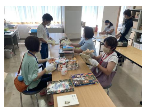
分類シールはり等