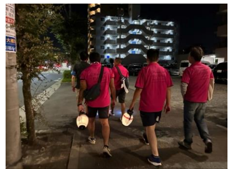
松江一中の皆さんと地域の夜回りに行ってきました。

学校は夏季休業中に江戸川区内の関連機関から様々なお話しをいただきました。江戸川区中学校を対象とする高校進学フェアでの特別支援学校の紹介を求められたり、町内会の「夜回り」の御案内をいただいたり、他にも「白鷺の作業学習で取組んでもらえませんか？」と作業素材の提供をいただいたり、多岐にわたる内容でした。改めて本校への地域からの期待とともに、理解推進の重要性を感じました。その様な地域からの期待に応えるためにも、充実した2学期になるよう体調を整え、元気に学校生活を楽しみましょう。