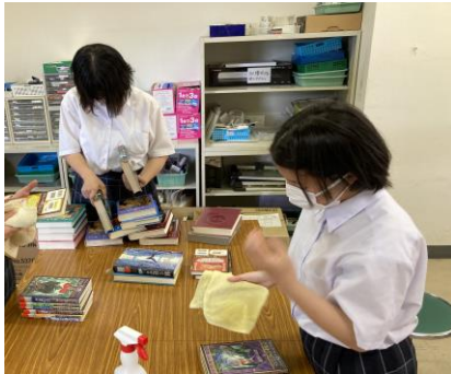
本のクリーニング