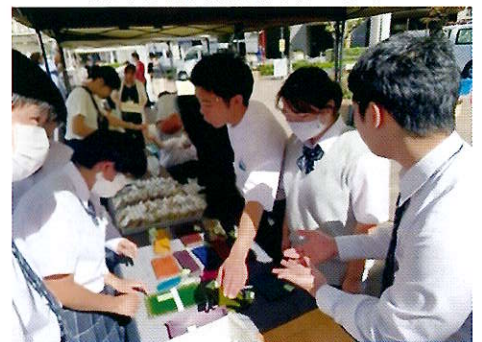
作業製品 販売活動の様子