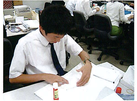
企業就労(事務系業務)

日々の学校生活や現場実習などを通して、自分のやりたいこと、できることを考え、働く意欲や挑戦する気持ちを大切に育みます。進路面談を実施し、主体的に進路選択・決定できるように指導しています。